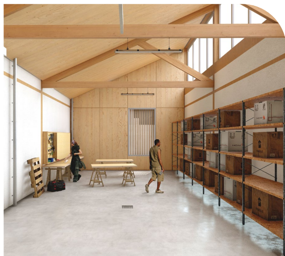
Visuels 3D : ©Atelier 56s